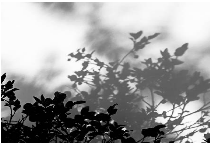
Kuva 4. Mustikanvarpu

Tallennan näkemääni usein kameran avulla. Luonnossa, varsinkin kevätaikaan tapahtumat ovat nopeatempoisia. Valo vaihtuu hetkessä. Uusia kasveja ilmaantuu päivittäin. (Kuva 4). Tallennan kasviaiheita myös perinteiselle prässitekniikalla, kuivattamalla papereiden ja painojen välissä.