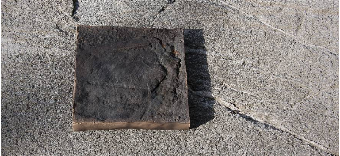
Kuva 12. Kalliolla