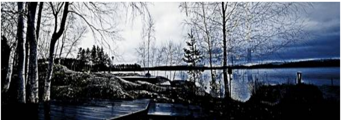
Kuva 2. Opottakallio

Aikanaan alue on ollut rauhatonta rajaseutua, kuuluen milloin Venäjään, milloin Ruotsiin. Asumme mieheni kotipaikalla. Talvisodan aikana tilan silloinen päärakennus paloi, ja 8 henkinen perhe asui sodan jälkeen saunamökissä, kunnes uusi talo valmistui. Oman sukuni puolelta molempieni vanhempieni takautuvat sukuhaarat johtavat samalle tilalle Parikkalan Kirjavalassa, jossa sukuni on asunut ainakin vuodesta 1754 lähtien. Minä asun tuosta paikasta alle 15 km:n päässä.