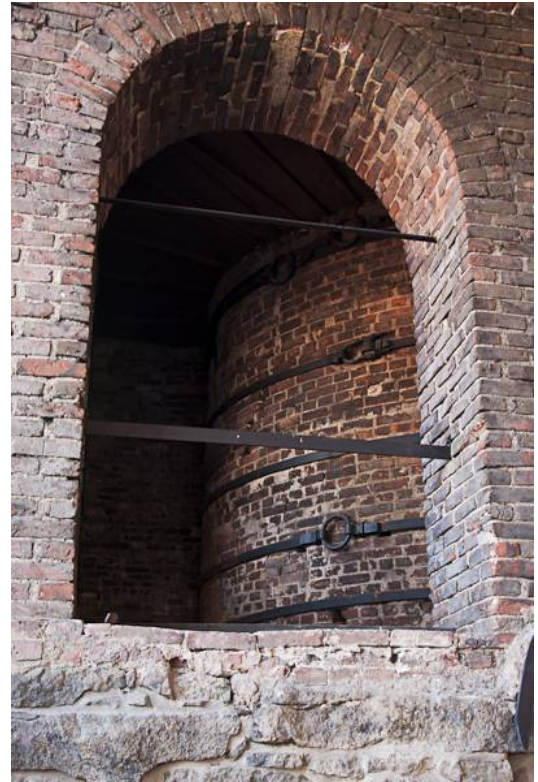
Kuva 16. Sisäkuva Teijon masuunilta

Ajoin pikkuteitä Teiskoon, jossa Tiinan vanhat puu-uunit ovat. Otin valokuvia niistä, varsinkin uunien sisätiloista ja piipunlähdestä. Toinen uuneista on Olsenin nopeapolttuuunin tyylinen, toinen isompi, jossa kaksi tulipesää uunin edessä. Piipun materiaalina galvanoitu ilmastointiputki (ainakin sen oloista), kestänyt kummankin uunin elinkaaren (yli 70 polttoa). Olisi materiaalina edullisempaa kuin teräshormi.