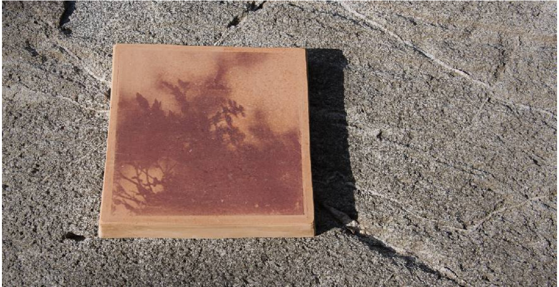
Kuva 9. Lopullinen sävy

Kuva-aiheet toistuivat ensimmäisessä poltossa varsin hyvin. Saven punaruskea värisävy on vielä varsin vaalea, mutta seuraava polttokerta tuo toivoakseni sävyä lisää. (Kuva 9).