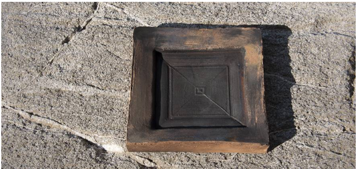
Kuva 10. Mattakuparilasitettu teos

Käytän henkilökohtaista paikan tajuani ja luontosuhdettani taiteellisessa toiminnassani lähtökohtana, tiedostan ja havainnoin sen tulkinnallisia merkityksiä, kokeakseni ja tarkastellakseni minulle tuttuja paikkoja eri aisteja ja näkökulmia hyödyntäen. (Kuva 10).