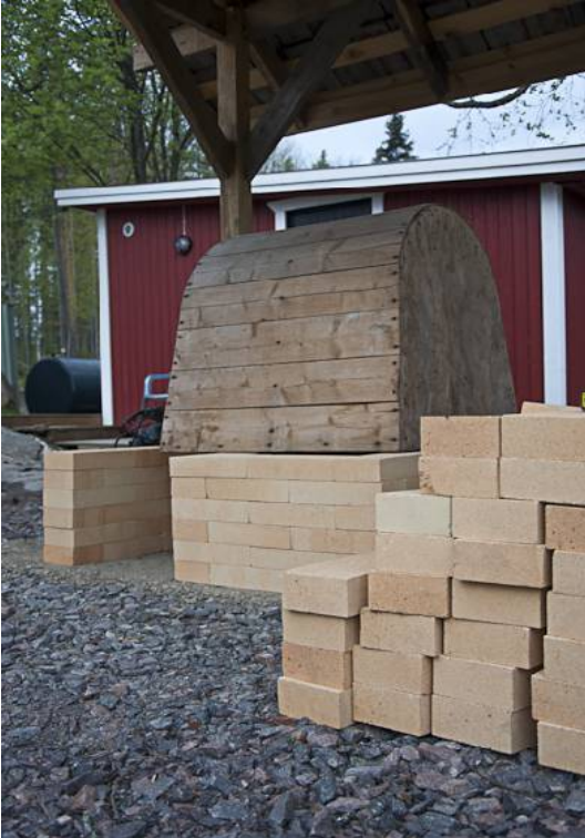
Kuva 17. Uunikammion muotti paikallaan

Valumassa: 3 mitallista eristystiilimurskaa + 2 mitallista savijauhoa + 2 mitallista vettä). Massaa seisotus n. 10 min. Uunikammion alaosassa käytin lastulevyjä tukena ja yläosa rakennettiin käsin painelemalla ja alhaalta ylöspäin kasvattamalla. Poistoilmakanava uunikammion takaseinässä on kooltaan noin 22 x 20 cm. Uunikammion etuseinämään tuli sahatut uunilevypalat (etuseinämälle ladotaan poltossa tulitiilet "oveksi") ja näin ne istuvat tiiviimmin. Aluksi muovi kevyesti päälle kuivumista hidastamaan. Muotti poistetaan vetämällä 2-3 viikon kuluttua, kunhan uunikammion holvi sen kestää.