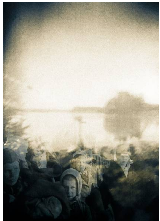
Kuva 3. Solarigrafiakuvia Opottakalliolta

Ajan ja paikan voi aistia: haistaa, kuulla ja maistaa. Aika on myös muistin asia, todellisuus muotoutuu vain muistissa. Muistojen paikat rakentuvat menneisyydestä käsin. (Karjalainen 1997.) Paikoilla on psykologinen merkitys; ne rakentavat meille juuria. (Kuva 3).