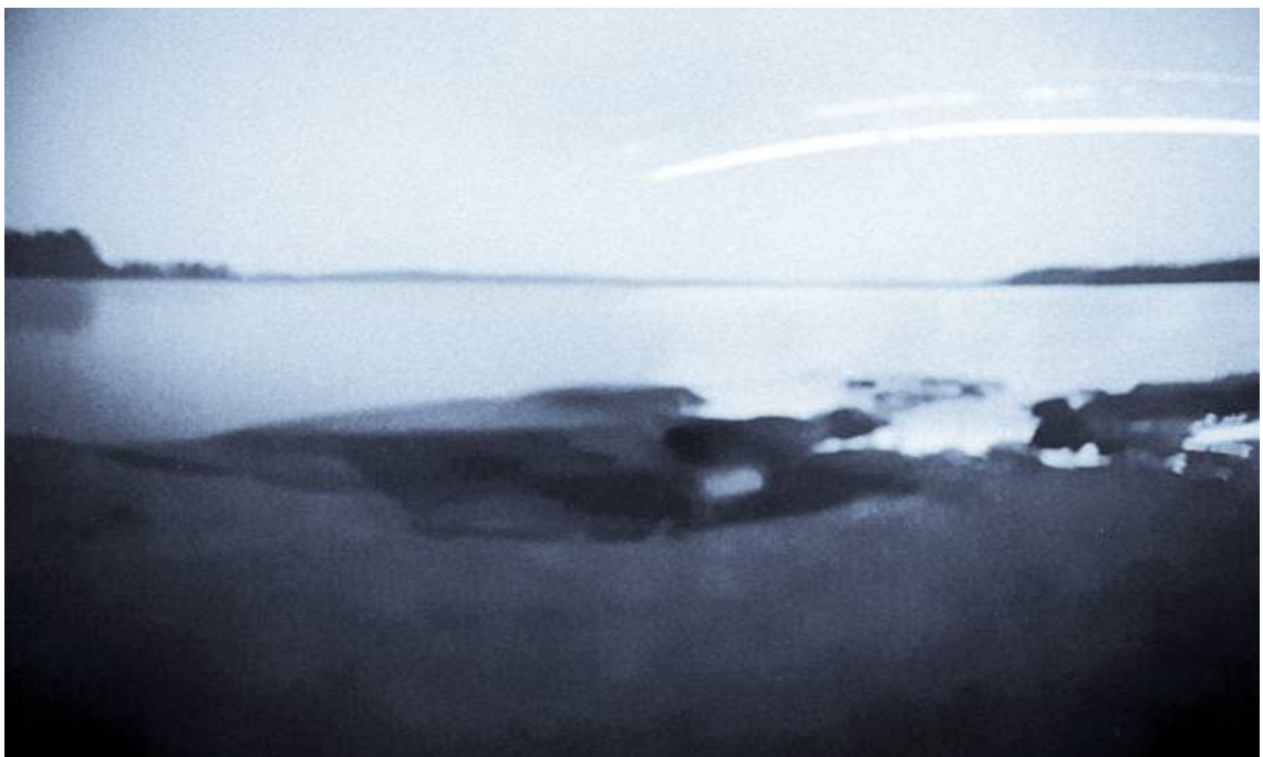
Kuva 1. Solarigrafiakuva Rutnikalta Tyrjänjärvelle, vastaranta Venäjää

Kertooko paikannimi ”Rutnikka” tuleville sukupolville jotakin? Sitä ei lue kartassa. Karjalan kielen sanakirjan mukaan sana rutnikka – rutniekka tarkoittaa rannalle nostettua järvimalmikasaa. Minä tiedän sen olevan pienen, hioutuneen kallioniemen, jossa lokit pesivät, taistelevat paikan herruudesta hanhien kanssa ja jossa joutsenet keväisin ja syksyisin levähtävät. Ennen paikkaa on käytetty järvimalmin nostopaikkana: ”työnteon paikkana”. (Kuva 1).