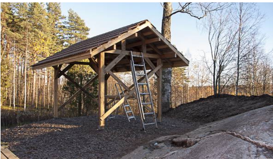
Kuva 14. Uunikatos syksyllä 2012

Sen alaosa on ladottu suorista, kovista, tulenkestävistä tiileistä, ilman laastia. Tulipesät sijaitsevat uunikammion alapuolella, vastakkaisilla sivuilla. Uunikammion holvikaari on valettu muotin avulla eristystiilimurskasta ja tulenkestävästä savesta paikan päällä tehdystä massasta. Katos uunille valmistui jo syksyllä 2012. (Kuva 14).