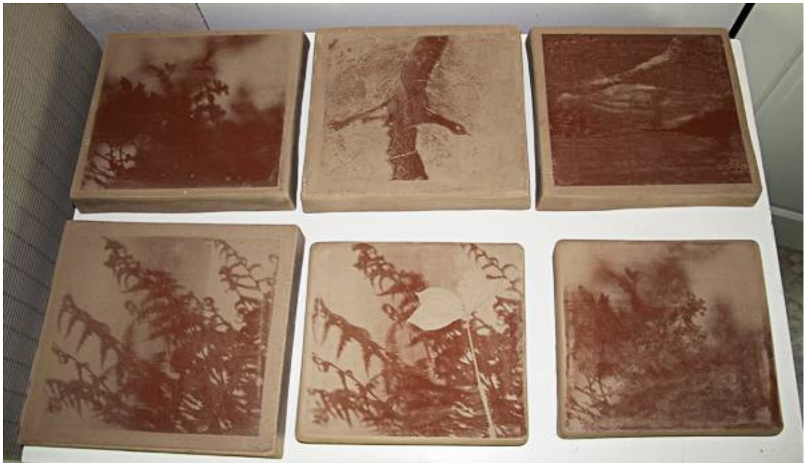
Kuva 8. Ensimmäisen kerran poltetut työt

Viikon–kahden hitaan kuivatuksen jälkeen vein uunillisen töitä Imatralla ensimmäiseen polttoon, eli korppupolttoon: ad 750 °C, alkuvaiheessa 80 °C/tunti ad 500 °C, sen jälkeen 150 °C/tunti, uuni saa jäähtyä itseksensä. (Kuva 8).