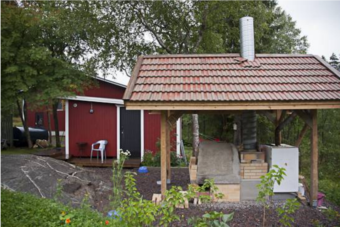
Kuva 18. Valmis uuni elokuussa 2013