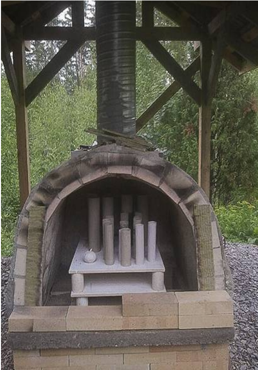
Kuva 19. Uunin ladonta

II poltto: Ensimmäinen varsinainen poltto uuni täytettynä (kuva 19). Pitkä raakapoltto, eli alkaen pienellä tulella, hitaasti lämmittäen ad 500°C ja sitten nopeammin ad 850°C. Puita täytyy pilkkoa pienemmäksi. Sytytys arinan alta ja kun kunnon hiillos alla, lisätään puita arinalle, jolloin saadaan parempi veto. Vetoa säädellään tarpeen mukaan (lämpötilaa seuraten) uunipeltiä sulkemalla ja avaamalla. Jätin uunin jäähtymään yön yli (uunipelti suljettuna). Polton kesto n. 5 tuntia.