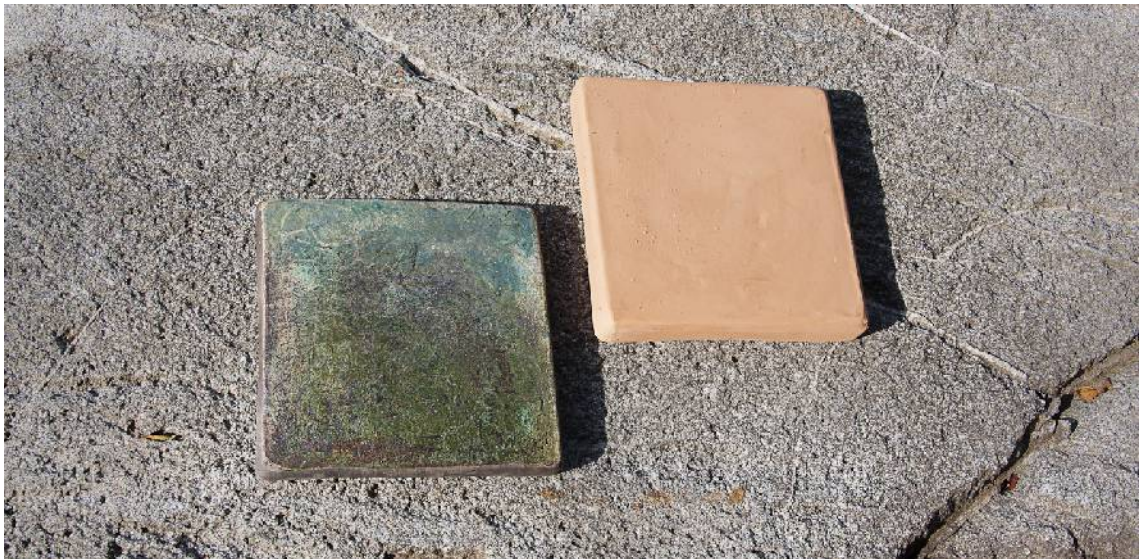
Kuva 11. Nimeämättömiä teoksia sarjasta ”Paikkani”

Käytän työskentelyssäni vaihtelevia tekniikoita; sitä joka kulloinkin tuntuu parhaiten vastaavan sen hetkistä ajatustani aiheesta ja siitä, miten sen parhaiten välitän eteenpäin katsojalle. Tämän tutkimukseni lähtökohtana oli oma lähiympäristöni ja se, miten tuon ympäristön tunnun – paikan tajun, sen hengen voisin parhaiten välittää katsojalle tulevissa opinnäytenäyttelyissämme Helsingissä ja Turussa. Tässä tapauksessa tulee helposti kliseinen maalainen – kaupunkilainen vastakkaisasettelu mieleen, mutta teen sen tietoisesti.