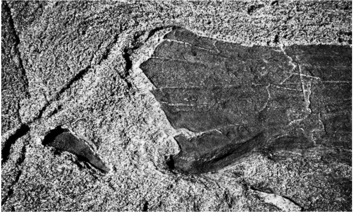
Kuva 5. Siipikuvio uunikatoksen kalliossa

Kallioiden pinnalla näkyvät uurteet ja kuviot ovat myös tärkeitä inspiraation lähteitä. Aamun matalalta tulevassa valossa ne näkyvät hyvin. (Kuva 5).