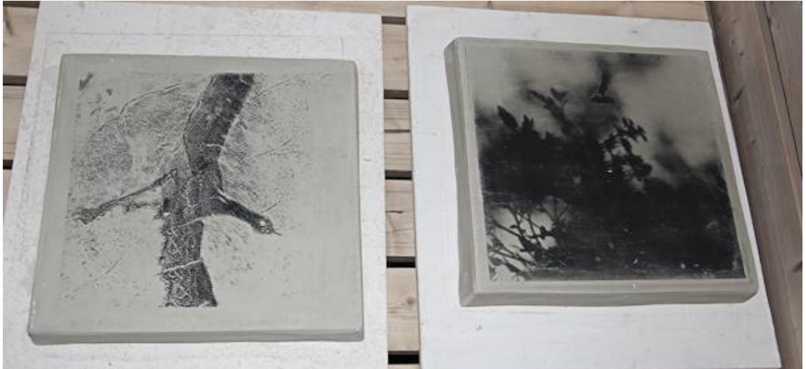
Kuva 7. Kuva siirrettynä