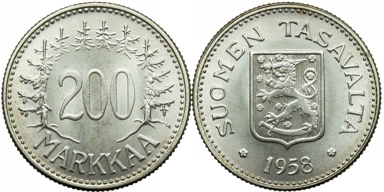
Kuva 3. 200 markkaa 1958, mukaellulla rahapajan johtajan kirjaimella H, josta on siis tehty kirjainta S muistuttava.

Lähempi vertailu osoittaa, miten mukaelma on tehty.