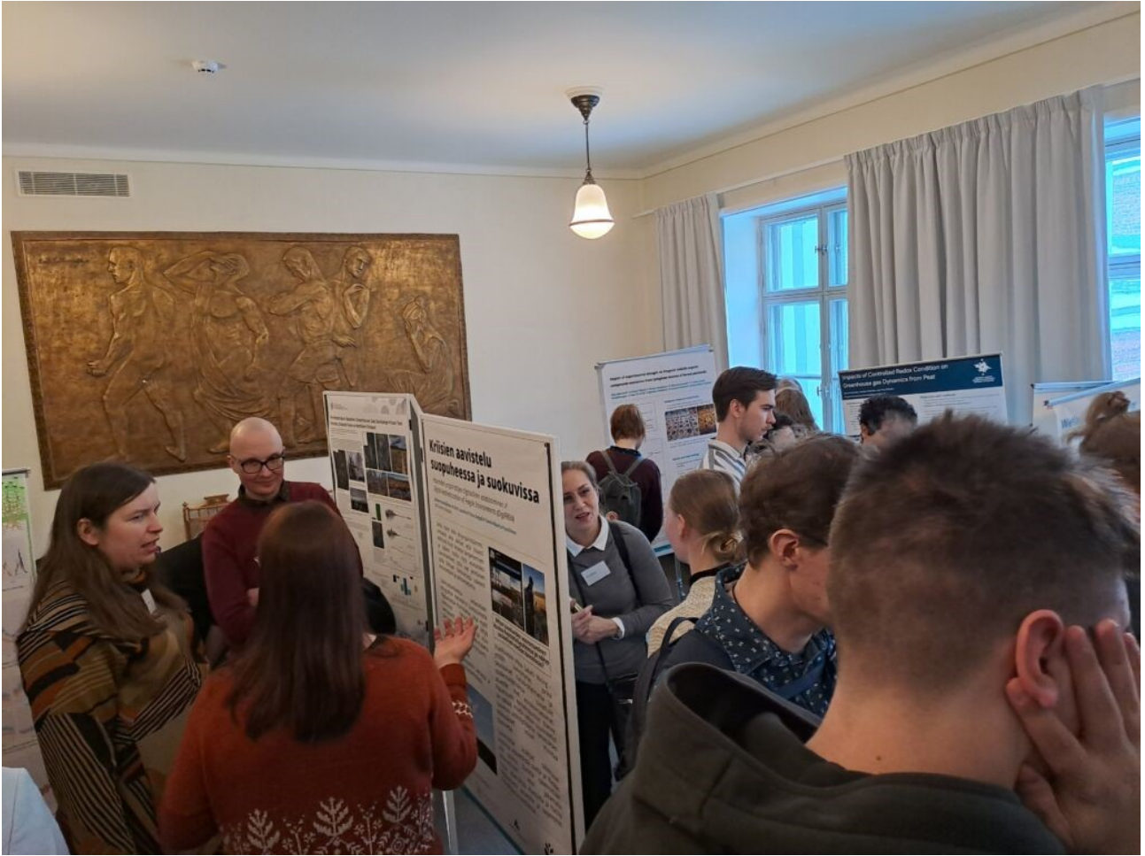
Kuva 1. Suopäivien postereilla oli tungosta Helsingissä Tieteiden talolla.