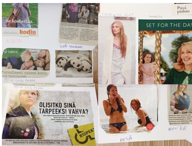
Kuva 7: Yksityiskohtia kollaasista.

Päivän virittäytymisenä toimi omien kuulumisten jakaminen ja yhteisen kollaasin rakentaminen. Kokosin pöydälle lehtiä, joista jokainen sai etsiä itselleen kuvan, mikä kuvasti omia ajatuksia. Lisäksi valitulle kuvalle annettiin myös nimi. Kaikki lähtivät reippaasti työskentelemään, ja huoneessa vallitsi keskittynyt hiljaisuus. Valitut kuvat liimattiin yksi kerrallaan suuralle kartongille samalla, kun kuvan valinnalle kerrottiin perusteluja. Vaikka tehtävän tarkoitusta selitettiin monta kertaa, ei se kaikille tullut välttämättä selväksi tai osa halusi muuten vain valita kuvan, joka yksinkertaisesti puhutteli tai oli mielenkiintoinen.