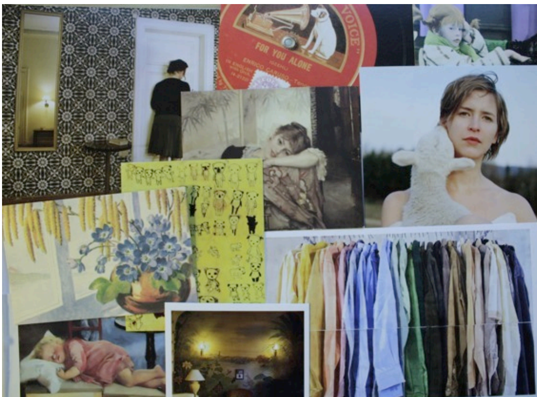
Kuva 10: Virittämisessä käytettyjä postikortteja.

Alkuperäinen suunnitelma siis laajeni albumikuvien katsomis- ja jakamisosiolla ennen omakuva-tehtävään siirtymistä. Tarkoituksena oli katsella valokuvia yhdessä yksi kerrallaan, mutta yhden henkilön kuvien ääreen ei oikein maltettu pysähtyä. Jotkut naisista ilmoittivat, ettei heillä ollut paperisia kuvia saatavilla, eikä kännykässäkään kuvia. Muutamat puolestaan olivat esitelleet omia albumikuviaan jo postikorttien läpikäymisen aikana. Päällekäisiä keskusteluja syntyi jälleen. Tämä johtui toisaalta osittain varmasti myös siitä, että kapean ja pitkän pöydän ääressä melko pienikokoisten kuvien katsominen oli hieman hankalaa, ja kuvien kierrättämien jokaiselle vei aikaa. En osannut ennakoida, ettei tila ollut ihan optimaalisin tähän tarkoitukseen. Naisista muotoutui pienempiä ryhmiä, joissa kuvia kuitenkin esiteltiin innokkaasti keskustellen. Välillä puhetulva vaimeni ja kuvia käytiin enemmän yhdessä läpi. Keskustelujen edetessä muutamat intoutuivat kaivamaan puhelimensa esiin ja esittelemään sieltä kuvia, vaikka olivatkin aikaisemmin todenneet, ettei kuvia ole. Valokuviin oli ikuistettu perhettä ja sen arkea, omaa lapsuutta eri vuosikymmeniltä, opiskeluaikoja, työelämää ja häätraditioita. Naiset kyselivät aktiivisesti toisiltaan kuvista ja niiden taustoista sekä jakoivat kokemuksia samaan aiheeseen liittyen. Uusiin ja vieraisiin asioihin suhtauduttiin uteliaan ihmettelevästi, hyväksyvää sekä kannustavaa palautetta antaen.