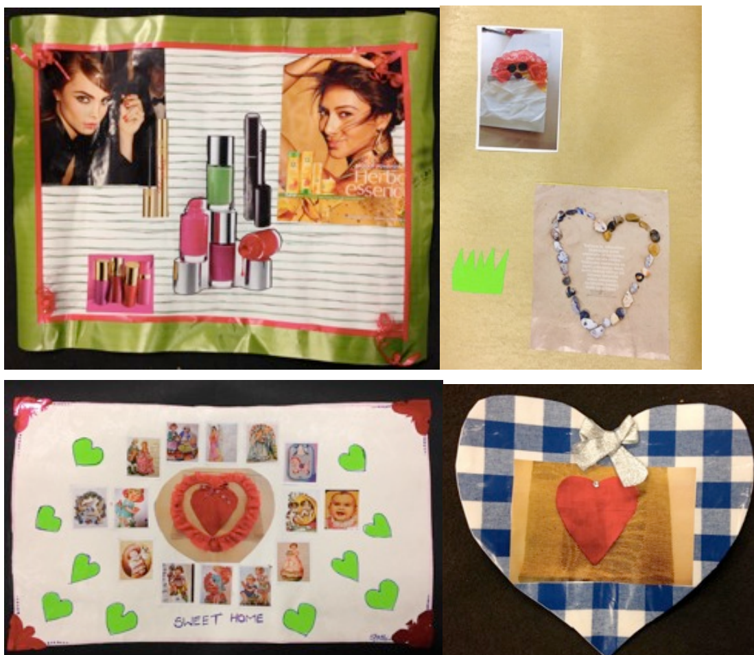
Kuva 11: Neljännessä työpajassa tehtyjä omakuvia.

via ilahtuneesti ja myös muiden ensimmäisiä omakuvia haluttiin katsoa. Toista omakuvaa varten käytössä oli jälleen erilaisia materiaaleja, kuten aikakauslehtiä, erilaisia papereita ja kartonkeja, nauhoja ja muita koristeita. Lisäksi tarjottiin mahdollisuutta ottaa valokopioita mukana tuoduista albumikuvista, mikäli niitä olisi halunnut liittää työhönsä. Kukaan ei kuitenkaan tarttunut tähän vaihtoehtoon. Tällä kertaa teimme pysyvät ja konkreettiset kuvat, joita ei työskentelyn lopuksi purettu. Naiset lähtivät keskittyneesti työskentelemään ja kyselivät selvästi aikaisempaa enemmän, mikäli eivät olleet jotain ymmärtäneet. Myös toisilta pyydettiin apua tarvittaessa. Muutamat naisista katselivat edelleen toimintaa enemmän sivusta ja tyytyivät lähinnä keskustelmaan. Yksi naisista oli aluksi hiukan hämmentynyt tilanteesta, sillä hän oli ollut pois sekä ensimmäiseltä kerralta että filmikuvauksesta. Hän ihmetteli miksi muille jaettiin omakuva, mutta hänelle ei. Tilanne toimi minulle samalla hyvänä huomiona siitä, miten olin huomaamattani sitonut työpajakerrat toisiinsa tavalla, joka asetti poissaolijat varsin hankalaan asemaan. Kävin naisen kanssa ensimmäistä työpajaa ja omakuvan ideaa läpi, jonka jälkeen hänkin ryhtyi työskentelmään oman työnsä parissa.