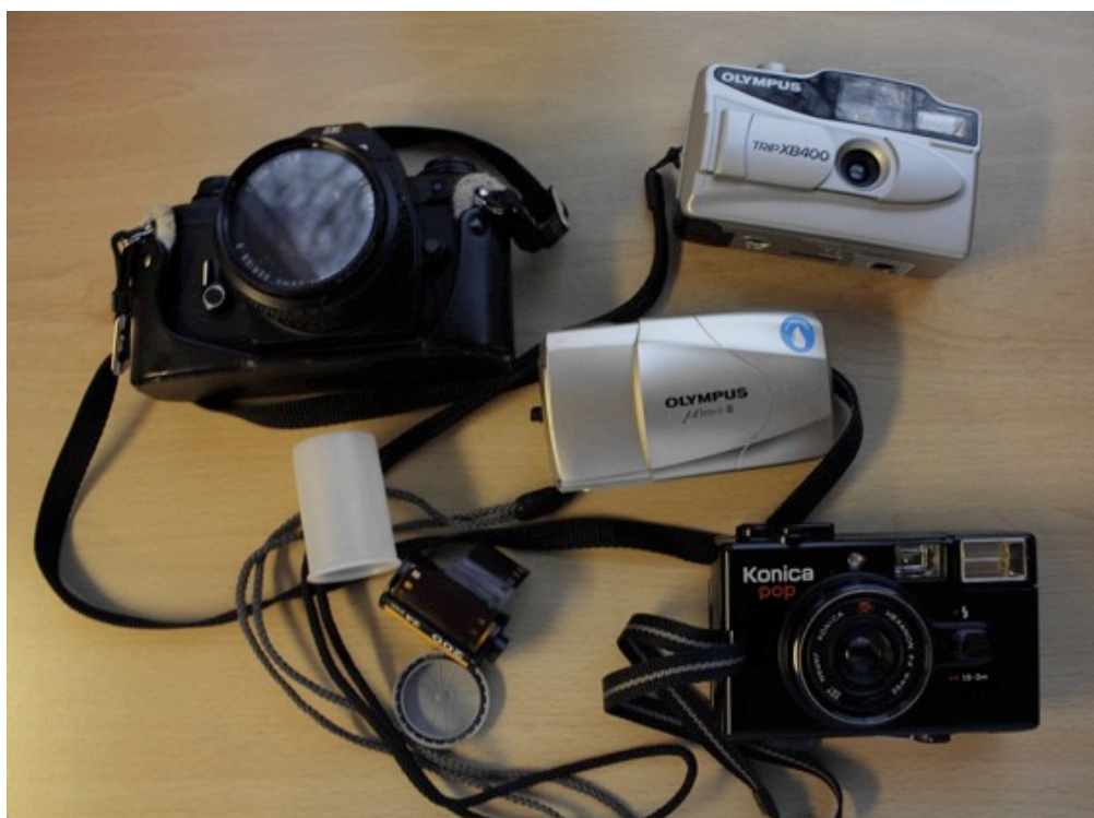
Kuva 6: Filmikuvaus-tehtävässä käytettyjä kameroita.

Valokuvien katsomisen jälkeen esittelin kotona tehtävän filmikuvaustehtävän, jonka aikana jokainen sai päiväksi mukaansa 24-kuvan filmikameran. Tutustuimme käytössä oleviin kameroihin, joista kaksi oli puolijärjestelmäkameroita ja kolme perinteisiä niin kutsuttuja pokkari-kameroita. Laitoin kamerat kiertämään, jotta jokainen sai kokeilla ja harjoitella kameran käyttöä. Kävin läpi myös muutamia vinkkejä kameroiden käyttöön ja vastailin kameroista heränneisiin kysymyksiin. Ennen lopetusta valitsimme yhdessä filmikuvauksellemme teeman 'Minun elämäni'. Lisäksi suunnittelimme kameravuorot tulevalle viikolle. Ensimmäiset saivat kameran mukaansa päivän päätteeksi. Huomasin vasta myöhemmin, että kaiken kiireen ja kameroiden lataamisen keskellä unohdin pyytää palautetta työpajastamme. Tarjouduin tulemaan Niceheartsiin päivittäin vaihtamaan kuvatut filmit uusiin, mutta työntekijät ilmoittivat hoitavansa filmien vaihdon itse. Toisen järjestelmäkameran kanssa ilmeni seuraavana päivänä ongelmia, mutta sain onneksi korvattua sen pokkarikameralla.