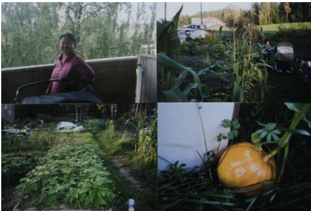
Kuva 9: Esimerkkejä filmikuvaustehtävän valokuvista.

Kolmannessa työpajassa tuli hyvin näkyväksi naisten keskinäisen vuorovaikutuksen lisääntyminen. Myöskään samaa äidinkieltä puhuviin ei tukeuduttu niin paljon, kuin aikaisemmin. Läsä oli edelleen jo aikaisemminkin esiin tullut tapa puhua toisten päälle tai käydä keskustelua vieressä istuvien kanssa jonkun muun puheenvuorolla. Valokuvat herättivät monessa selvästi innostusta, joka välillä purkautui samanaikaisena puheena, kun jokainen olisi halunnut kertoa