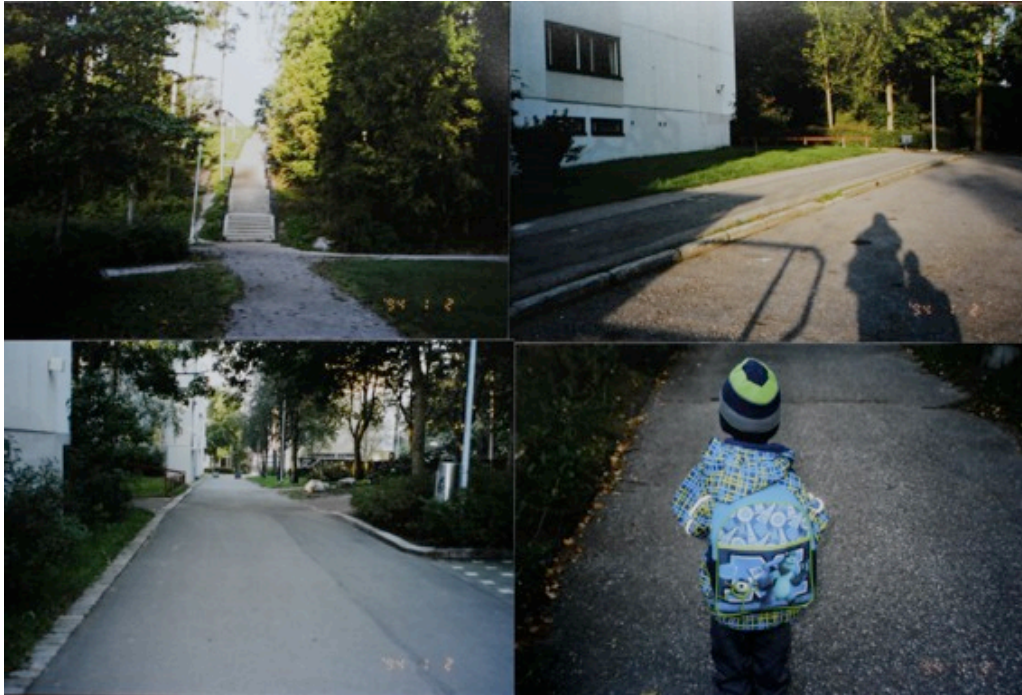
Kuva 8: Filmikuvaustehtävän antia.