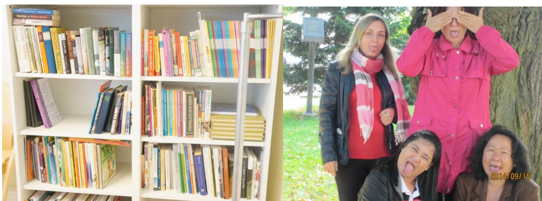
Kuva 5: Kolme yhdistävää asiaa-tehtävän tuloksia.

Kuvaamiseen suhtauduttiin monenlaisin tavoin. Jotkut naisista olivat tarkkoja siitä, etteivät he näkyneet valokuvissa, mutta kuvasivat kuitenkin mielellään itse. Muutamat taas viihtyivät myös kuvattavana. Tehtävää lähestyttiin konkreettisten asioiden, esineiden ja ympäristön kuvaamisen kautta. Kahdessa ryhmässä naiset tai osa heistä olivat kuvissa esittämässä tai ilmentämässä jotain yhdistävää tekijää. Pienryhmissä löydetyt yhdistävät asiat liittyivät uteliaisuuteen, luontoon ja kasveihin, liikuntaan, suomen kieleen, määrätietoisuuteen, elämänsäntekemisiin, kesään ja matkustamiseen. Kuvat katsottiin yhdessä läpi, pienryhmät kertoivat ottamistaan kuvista ja muut kyselivät tai kommentoivat kuvia. Kuvien katsominen ei saanut aikaan erityisen vilkasta keskustelua, mutta tunnelma oli kuitenkin iloinen ja naiset kehuivat kohteliaasti toistensa kuvia. Yleisesti työpajan aikana oli selvästi havaittavissa, että vaikka samaa äidinkieltä puhuviin tukeuduttiin edelleen paljon, oli naisten välille syntynyt myös