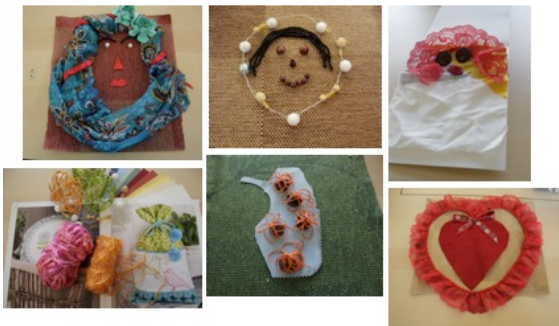
Kuva 2: Naisten omakuvia ensimmäiseltä työpajakerralta.

Itse työskentelylle eli omakuva-tehtävälle jäi huomattavasti vähemmän aikaa kuin olin alun perin suunnitellut, tunti lyheni vajaaseen puoleen tuntiin. Omakuva-käsitteen selittämiseen ja havainnollistamiseen meni myös jonkin verran aikaa, sillä omakuva-terminä oli monelle vieras. Olin tehnyt kotona esimerkkiversion omakuvasta, mitä käytin tehtävän esittelyn tukena. Työskentelyyn lähdettiin varsin vaihtelevasti mukaan. Muutamat tekivät todella nopeasti ja määrätietoisesti, osa taas sommitteli ja suunnitteli omakuvaansa hartaudella, joten tehtävään käytettävä aika oli heille auttamatta liian lyhyt. Muutamat naisista arastelivat työn aloittamista, ja katselivat aluksi vain toisten työskentelyä. Nämä hieman sivulle jättäytyneet naiset saivat omakuvansa kuitenkin tehtyä toisten naisten avustuksella. Jokainen valokuvasi omakuvansa, jonka jälkeen kuvat siirrettiin tietokoneelle ja katsottiin videotykin kautta yhdessä. Osa tarttui kameraan rohkeasti ja uteliaasti, toiset taas arastelivat kameraa ja pysyivät minun kuvaavan heidän omakuvansa. Loppujen lopuksi kaikki kuitenkin kuvasivat työnsä itse neuvojen ja pienen rohkaisun avulla. Suunnitelmissani oli, että jokainen olisi saanut kertoa enemmän omasta työstään, mutta ajan rajallisuuden vuoksi tyydyimme katsomaan yleisesti kuvat sekä keskustelemaan niistä. Naiset ihastelivat ja kehuivat toistensa töitä kohteliaasti, mutta sen enempää töitä tai työskentelyä ei päädytty analysoimaan.